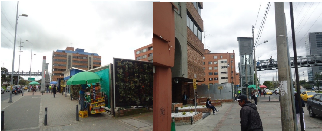
Foto panorámica donde se encontraba instalado el